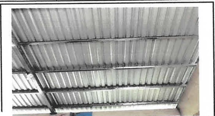
Foto1: Sustitución de techo y estructura metálica.