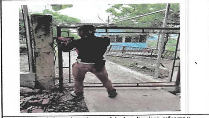
Foto 4: Mantenimiento de portones existentes , limpieza, refuerzo y pintura.